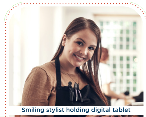
Smiling stylist holding digital tablet

NC Medicaid now covers more cosmetologists, hair stylists and barbers.