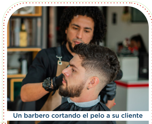
Un barbero cortando el pelo a su cliente

Llamando a tu oficina local del DSS ncdhhs.gov/localDSS