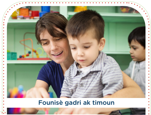
Founisè gadri ak timoun