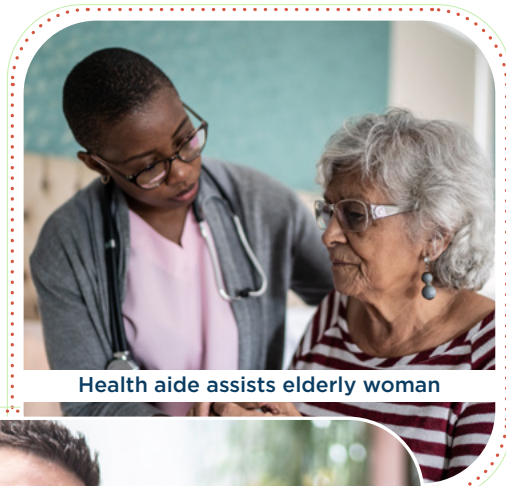
Health aide assists elderly woman