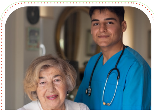
Un asistente de salud sonriente ayuda a una señora de mayor edad

Llamando a tu oficina local del DSS ncdhhs.gov/localDSS