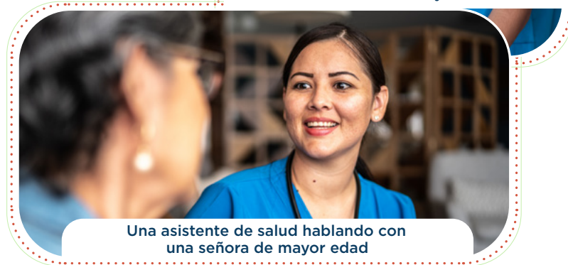
Una asistente de salud hablando con una señora de mayor edad

La mayoría de personas podrán obtener cobertura médica a través de Medicaid si cumplen con los criterios a continuación. Y si eras elegible antes, todavía lo eres.