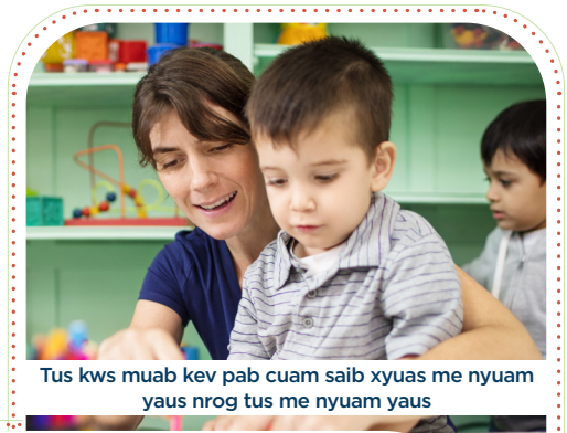
Tus kws muab kev pab cuam saib xyuas me nyuam yaus nrog tus me nyuam yaus