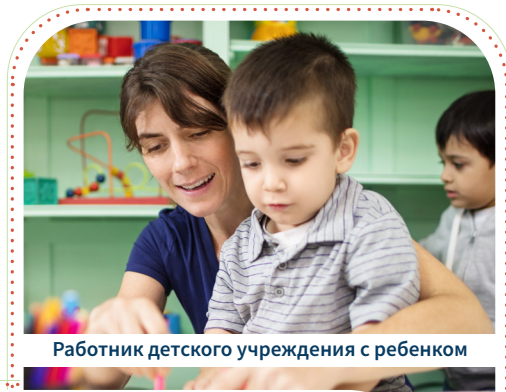
Работник детского учреждения с ребенком